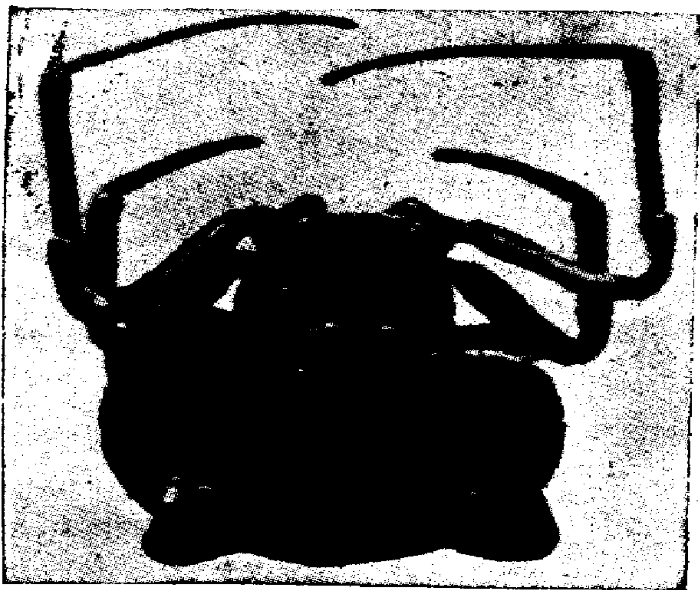
FIG. 16.— Mastophora gasteracanthoides , × 2. Vista por su cara dorsal.