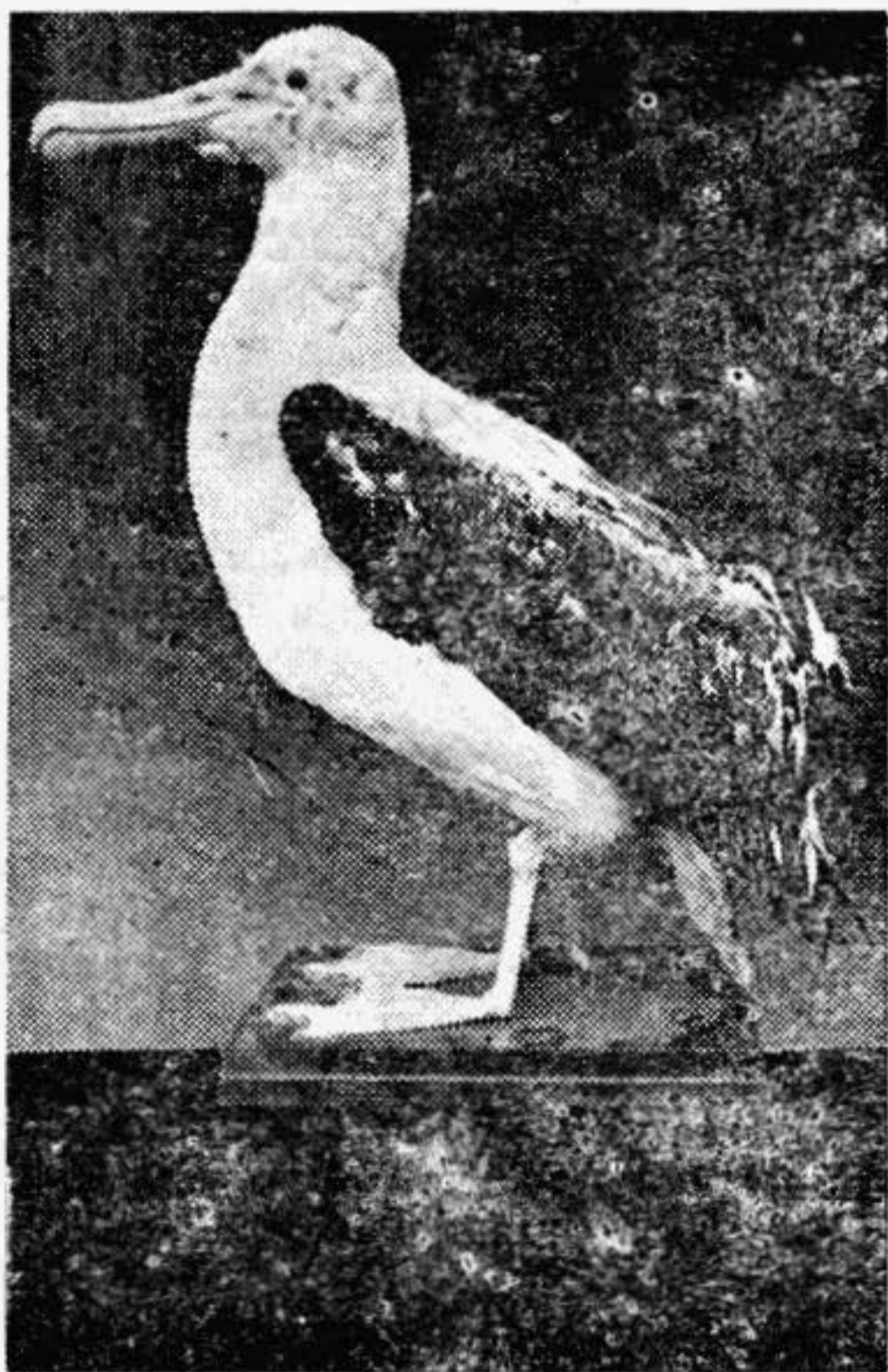
El albatros A-99 de lado (*)