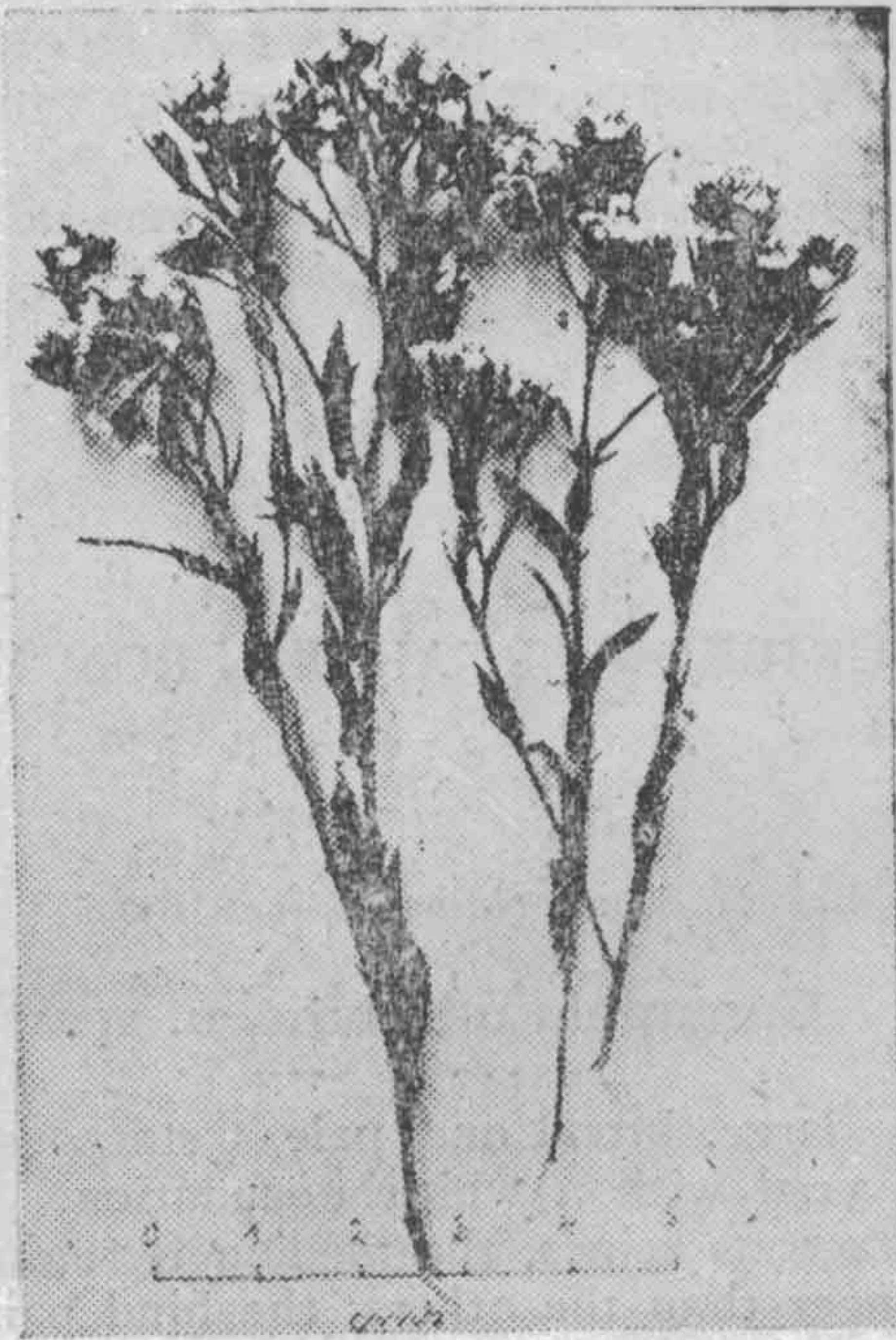
Fig. 31.— Triptilum spinosum , R. et P.

Es una especie afin a la O. polymallum Phil. con los ejemplares condensados en masas globosas, densamente lanudas. Hojas atejadas, linealmente espatuladas, lanudas, con pelos rojos en el ápice. Las cabezuelas solitarias, densamente embutidas en el extremo de las ramitas: las hojas supremas sirven