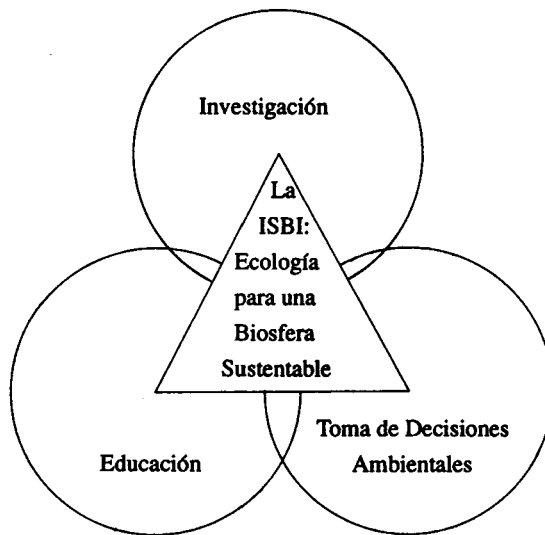
Fig. 2: Interacciones interdisciplinarias requeridas por la iniciativa internacional para una biosfera sustentable (ISBI) (Lubchenko et al. 1991).

2.1 Investigación: Las lecciones aprendidas de programas internacionales de investigación anteriores indican que ISBI debería incluir los siguientes elementos en su enfoque estratégico: